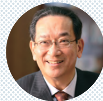
審査委員長 北川正恭

マニフェスト大賞は、地方自治体の議会、首長、市民等による、地域の民主主義向上に資する優れた取り組みを募集し、表彰するものです。これにより、地域で努力を重ねる方々に荣誉を与え、さらなる意欲向上を期するとともに、優れた取り組みが広く知られ互いに競いあうようにまちづくりを進める「善政競争」の輪を拡げることを目的としています。政策本位の政治、生活者起点の政策を推進するために、ご注目頂くとともに、奮ってのご応募をお待ちしています。