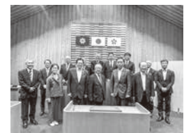
津別町議会の皆さんと