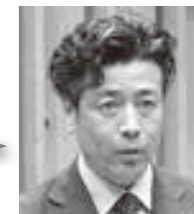
渡辺 洋一郎 議員

①住宅に困窮する低所得の方が安定した生活をする住宅であり、町は必要戸数の確保と適切な維持管理を行う考えである。 ②今後4年間で90戸の整備を計画し、現在、新年度の事業者選定を進めている。 ③居住者への計画的な説明と共に必要な修繕は継続し、健全な環境確保に努める。 ④整備事業者の応募がない要因等を検証するなど、他の手法も検討し、建替事業が効果的・効率的に進むように取り組む。