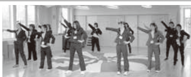
表紙写真 ひだまり保育所の入所式✿ とってもかわいい8人の新入児さんを、元気あふれる先生のダンスでお出迎えしました。