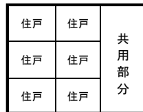
②共同住宅等の場合