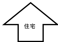
①一戸建て住宅の場合

共同住宅等や複合建築物において、住戸ごとの認定が廃止となり、複合建築物については建築物全体に加え、住宅部分、非住宅部分での認定が可能となります。認定申請単位の変更により手数料の区分も変更致します。