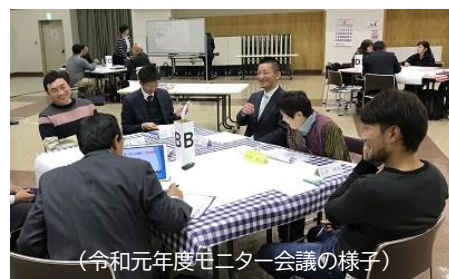
(令和元年度モニター会議の様子)

を主とし、具体的には、①議会運営への提言、②議会広報及びホームページへの提案、③議員との意見交換