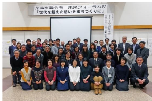
(H30 未来フォーラムIVより)