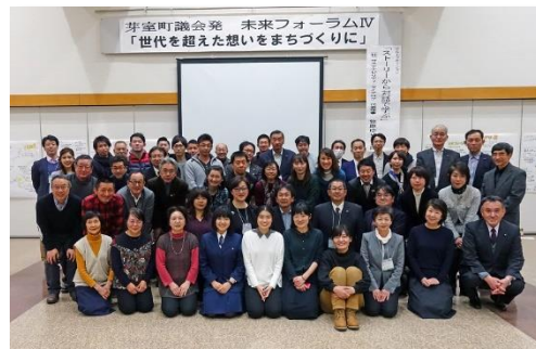
（H30 未来フォーラムIVより）