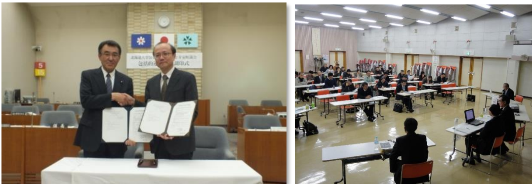
北海道大学公共政策大学院との包括的連携協定経過・事業実績等（締結時から R 5 まで）

包括連携事業は、これまでの間、大学教授及び大学院生の協力を得て、議員報酬・定数シンポジウム、公共施設マネジメントセミナーなどの他、議会 ICT・公共交通・自治法改正等、多くの分野の研修会を開催しています。