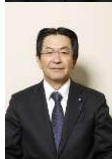
さなえ ゆたか 早苗 豊