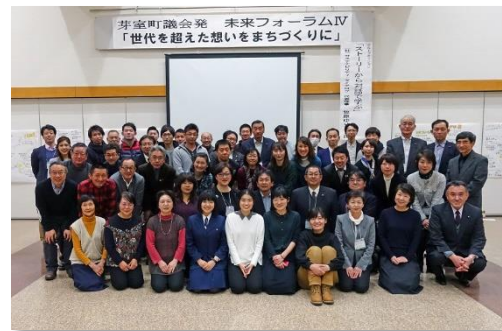
(H30 未来フォーラムⅣより)