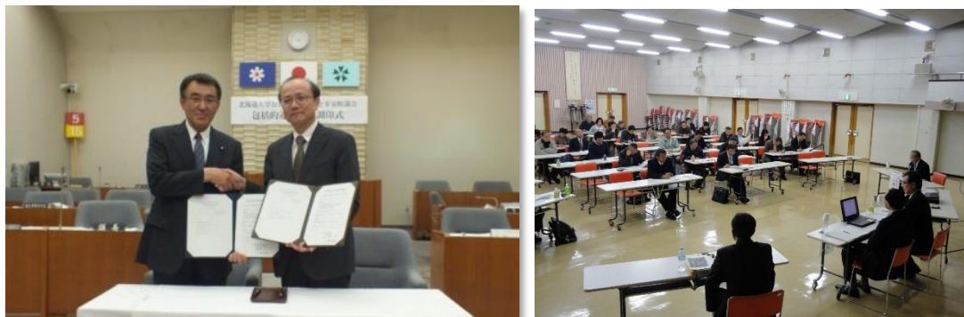
北海道大学公共政策大学院との包括的連携協定経過・事業実績等（締結時から R 6 まで）

包括連携事業は、これまでの間、大学教授及び大学院生の協力を得て、議員報酬・定数シンポジウム、公共施設マネジメントセミナーなどの他、議会 I C T ・公共交通・自治法改正等、多くの分野の研修会を開催しています。