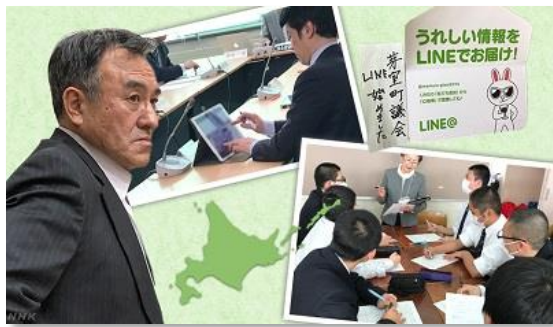
(NHK Web「政治マガジン」より)