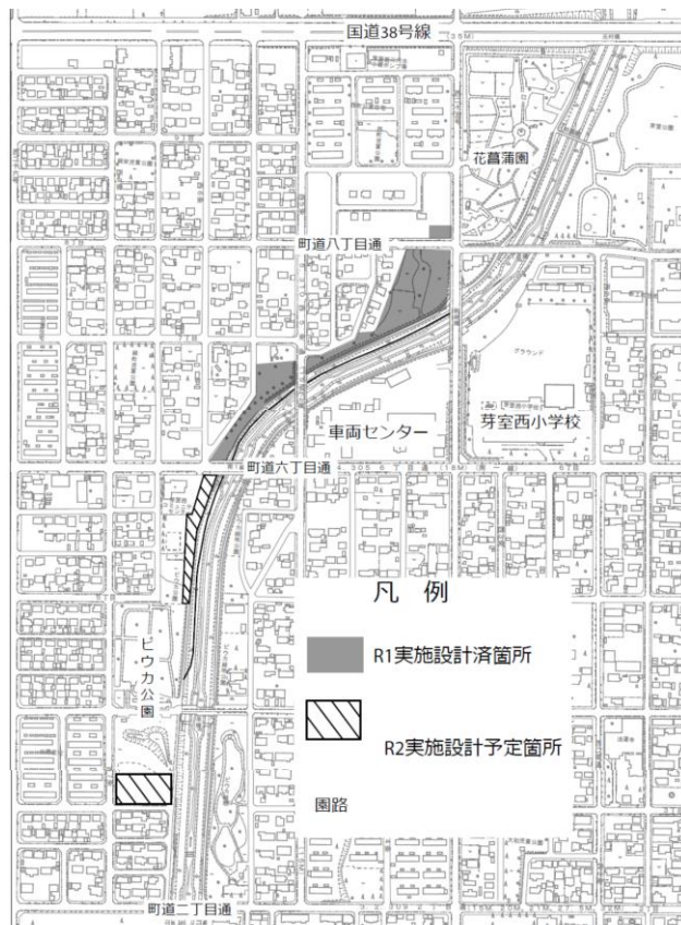
令和2年度 ピウカ川親水公園実施設計位置図