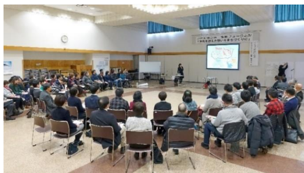
（H30年度 未来フォーラムⅣ）

住民参加手法の一つである、議会報告と町民との意見交換会（議会フォーラム）は、議会側から地域課題の解決策を政策立案・提言する議会政策形成サイクルを構築するための重要な装置となっています。「報告・意見交換会」を議会活動の起点とし、住民との対話を通じて、住民の声を基に総合計画（実施計画・実行計画・個別計画など）をベースに各常任委員会で調査と研究を進め、「政策提言する議会」を目指す本町議会のかたちを形成しつつありますが、今後はいかに議論・対話から、「収穫」へとつなげていく実践の場として発展させていくのか、その仕組みづくりに向けた取組みが不可欠です。