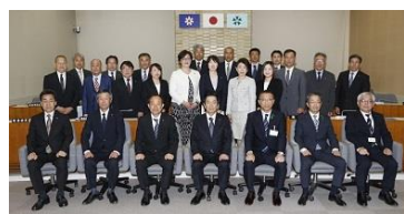
[議会 - 二元代表制の一翼]