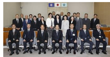
[議会 - 二元代表制の一翼]